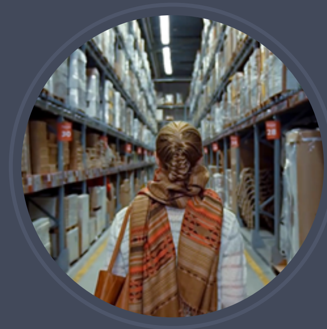
IKEA - Commercials