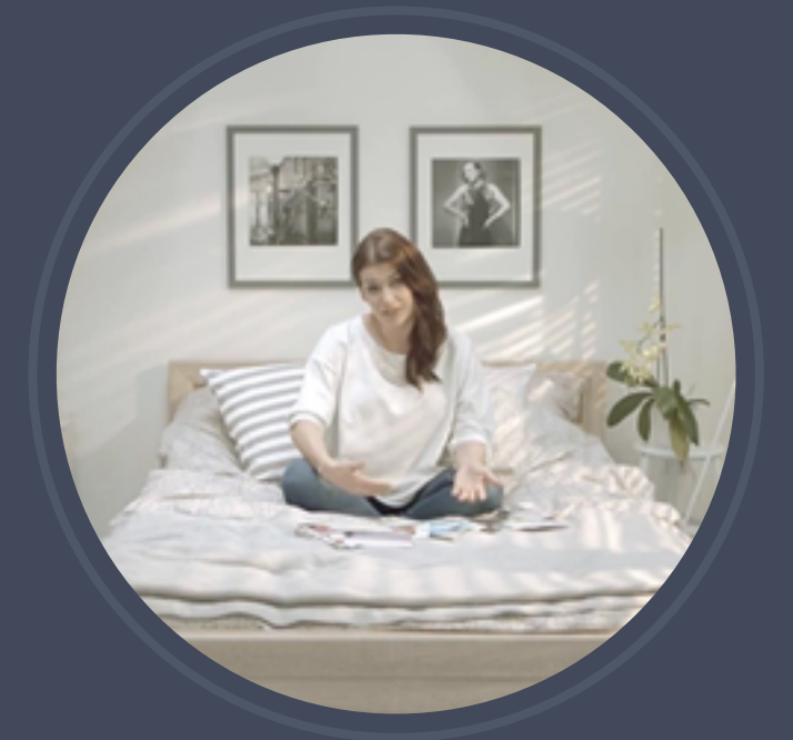
Tchibo - Video Blog