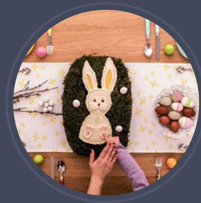
Tchibo - DIY