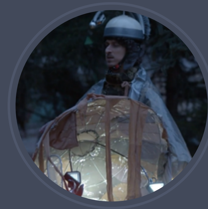
Red Bull - Documentary