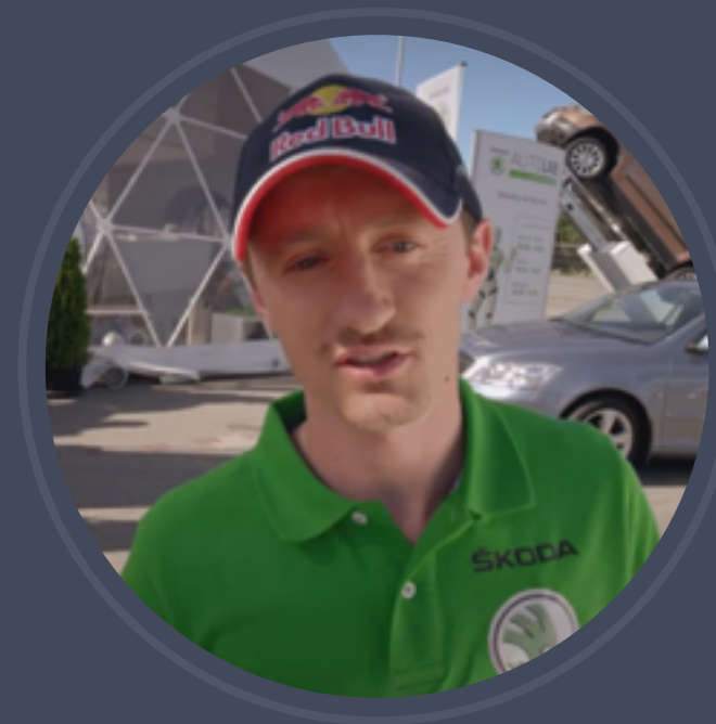
Skoda - Educational Series