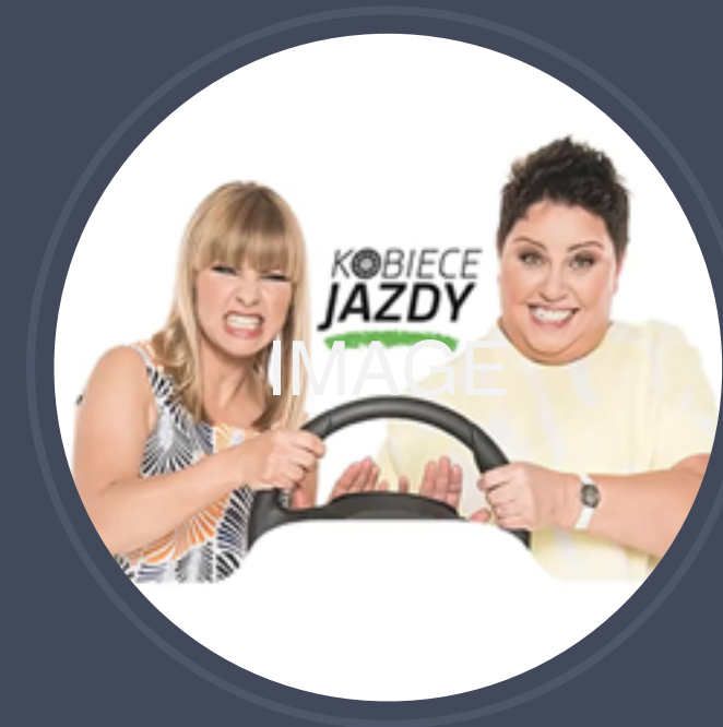
Skoda - Talk Show