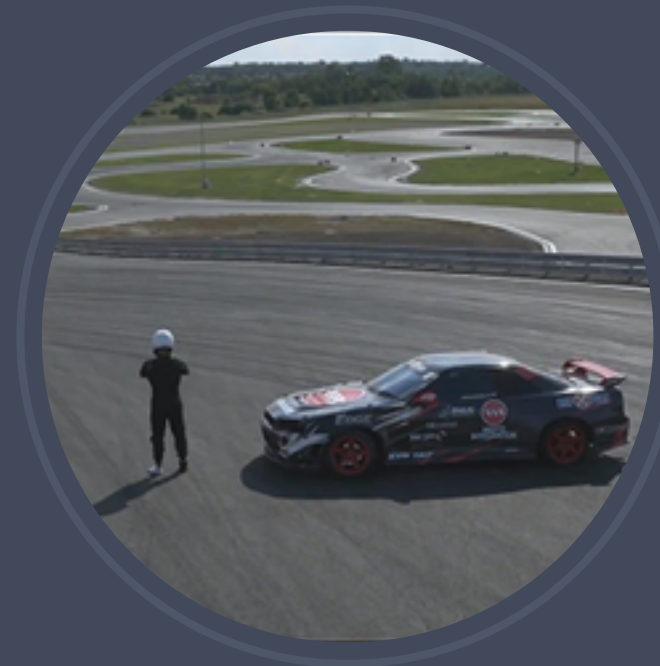
Castrol - Documentary