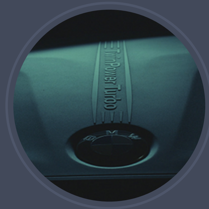
Castrol - Commercial

30 sekundowa reklama do telewizji to najmniej z tego, co możemy dla Ciebie zrobić.